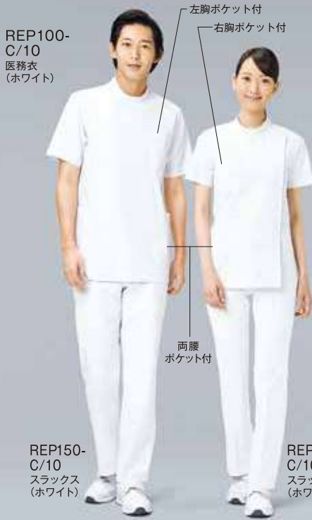
REP100-C/10 医務衣 (ホワイト)