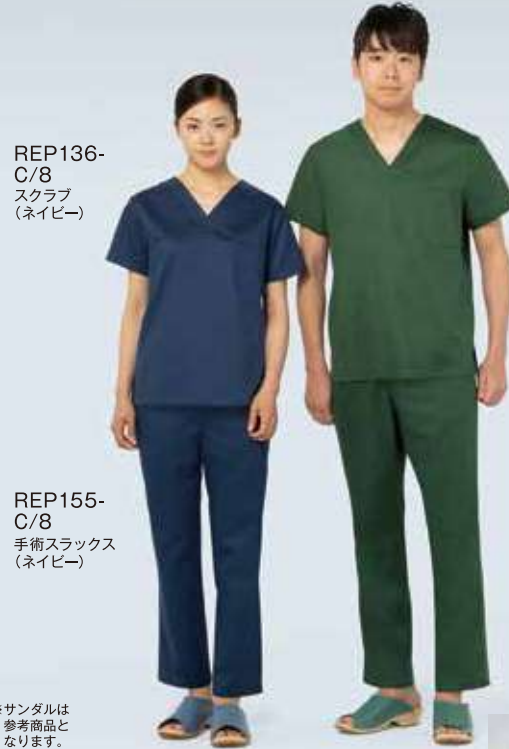
REP136-C/8 スクラブ (ネイビー)

腕の前後運動や上下運動に伴う不快な突っ張り感を軽減し、よりスムーズな動きを可能に。