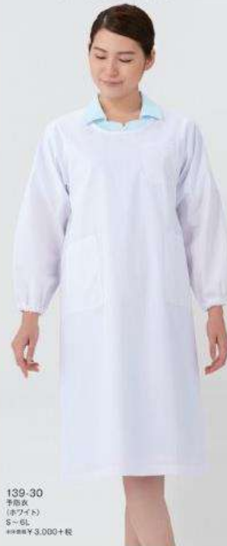
139-30 予防衣 (ホワイト) S~6L ※税別 ¥3,000+税