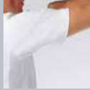
REP105-C/10 医務衣 (ホワイト)