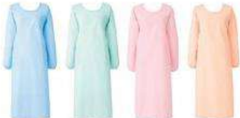
139-31 (サックス) 139-32 (ミントグリーン) 139-33 (ピンク) 139-36 (オレンジ) S~5L S~5L S~5L S~5L ±税別 ¥3,000+税 ±税別 ¥3,000+税 ±税別 ¥3,000+税 ±税別 ¥3,000+税