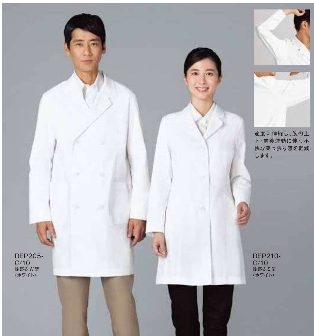
REP205-C/10 診察衣W型 (ホワイト)

・抗菌性、抗ウイルス性の評価に関しましては、倉敷紡績(株)の独自評価によるものです