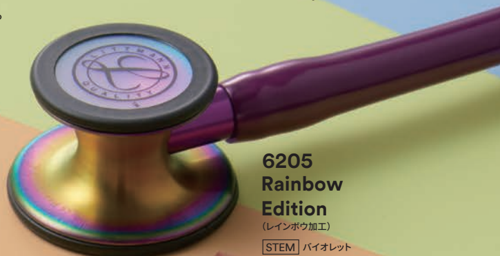
6205 Rainbow Edition (レインボウ加工)