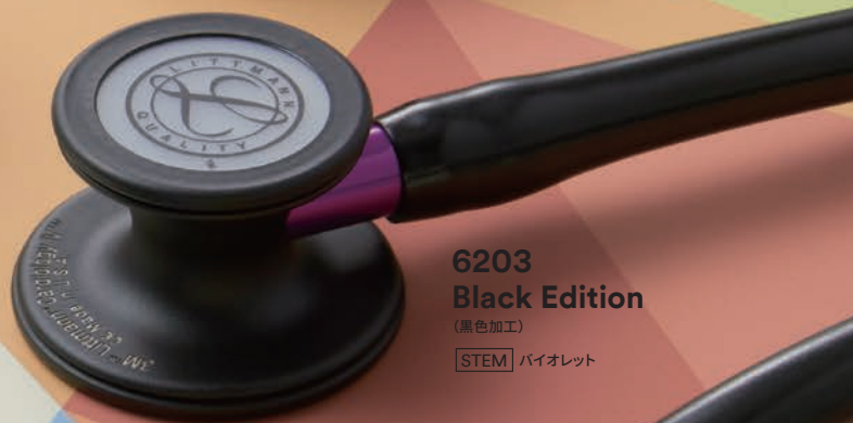
6203 Black Edition (黒色加工)