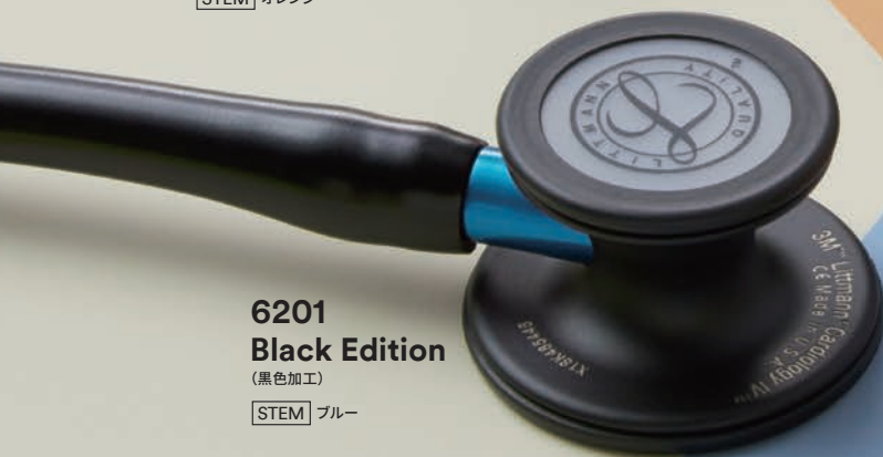
6201 Black Edition (黒色加工)