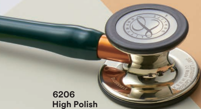
6206 High Polish Champagne Edition (ハイポリッシュシャンパン加工)