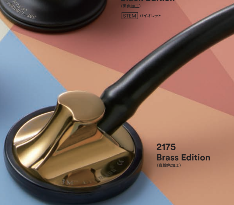
2175 Brass Edition (真鍮色加工)