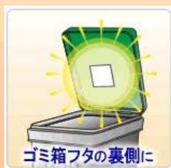
ゴミ箱フタの裏側に